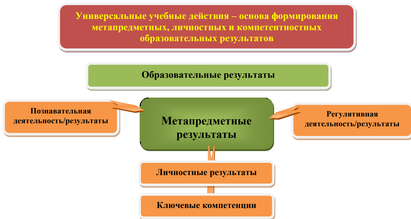
Рис. 3. Система оценки образовательных результатов

Система оценки предусматривает уровневый подход к представлению планируемых результатов и инструментарию для оценки их достижения. Согласно этому подходу за точку отсчёта принимается не «идеальный образец», отсчитывая от которого «методом вычитания» и фиксируя допущенные ошибки и недочёты, формируется сегодня оценка ученика, а необходимый для продолжения образования и реально достигаемый большинством учащихся опорный уровень образовательных достижений. Достижение этого опорного уровня интерпретируется как безусловный учебный успех ребёнка, как исполнение им требований Стандарта. А оценка индивидуальных образовательных достижений ведётся «методом сложения», при котором фиксируется достижение опорного уровня и его превышение. Это позволяет поощрять продвижения учащихся, выстраивать индивидуальные траектории движения с учётом зоны ближайшего развития.