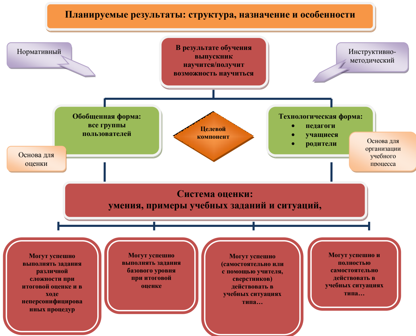
Рис. 1. Особенности структуры планируемых результатов. Функция и назначение.

Описание организации и содержания промежуточной аттестации, итоговой оценки и оценки проектной деятельности (п. 1) приводится в соответствующем разделе в образовательной программе образовательного учреждения. Используемый образовательным учреждением инструментарий для стартовой диагностики и итоговой оценки (пп. 2—5) приводится в Приложении к образовательной программе образовательного учреждения.